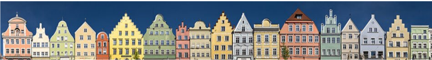
Bastelarbeiten einer Häuserzeile und von U-Bahnsteigen